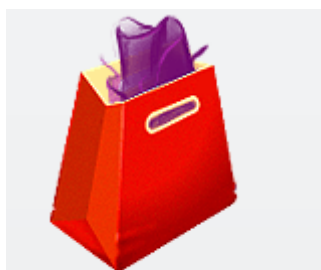
Интернет-магазин Light 42500 рублей