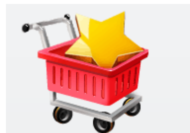
Интернет-магазин Premium 111900 рублей

Профессиональное создание интернет магазина, а также его разработка максимально удобно и для своего владельца, и для покупателей. Так, владельцы таких интернет ресурсов имеют следующие преимущества: высокую рентабельность электронного магазина, отсутствие платы за аренду офиса и складского помещения, сведение к минимуму количества персонала, неограниченный трафик посетителей ресурса.